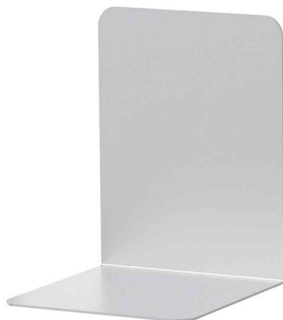
Visuel de référence: Serre-livres en aluminium, hauteur: 130 mm