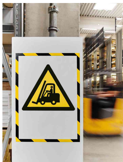
Visuel de référence: montre le produit en utilisation