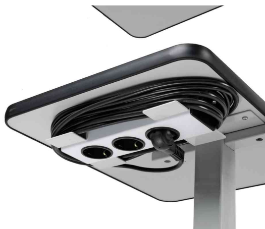
Projektionswagen EuroLine DVP II, Steckdose