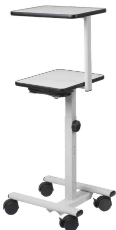
Projektionswagen EuroLine DVP II