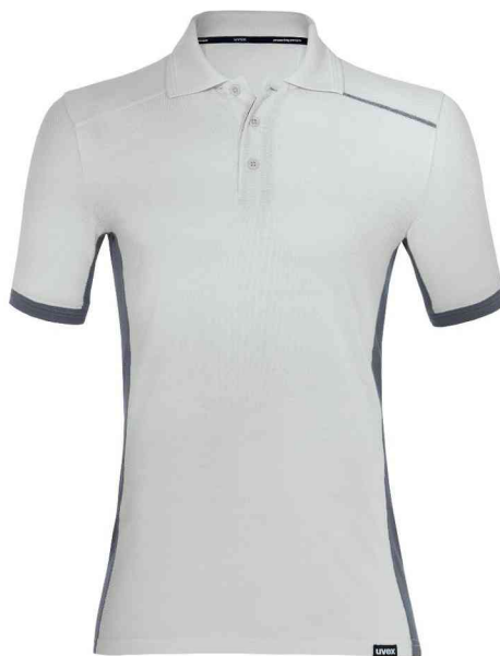
Polo suXXeed industry, gris clair