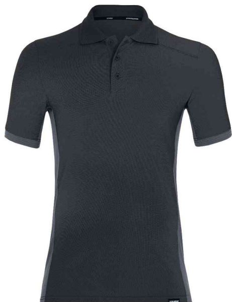
Polo suXXeed industry, graphite