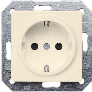
DELTA i-system elektroweiß SCHUKO mit Kinderschutz, ohne Krallen 55x55mm 10/16A 250V