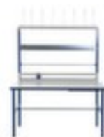
Table d'emballage complète