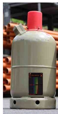
Visuel de référence : montre le produit en utilisation