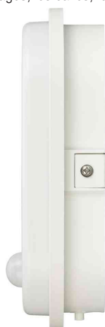
Lampe à LED ovale, à détecteur de mouvement infrarouge, vue latérale