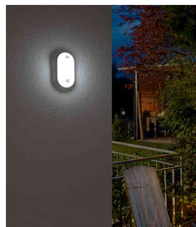
Visuel de référence : présente le produit en utilisation