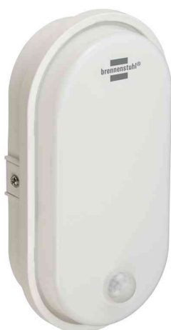
Lampe à LED ovale, à détecteur de mouvement infrarouge