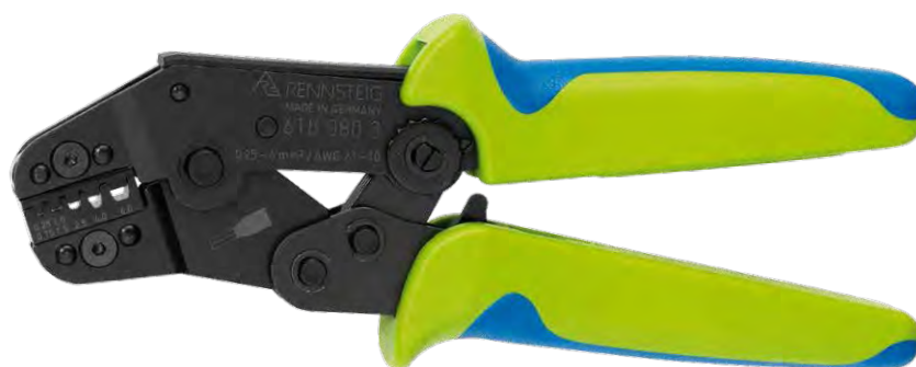
Art. No. 618 080 3