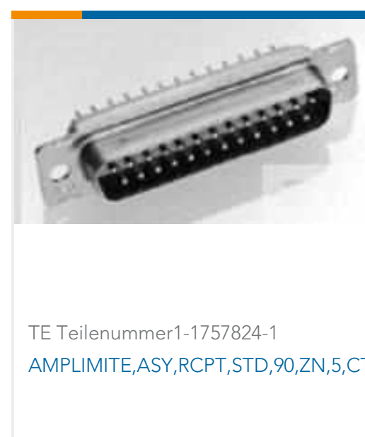
TE Teilenummer 1-1757824-1 AMPLIMITE, ASY, RCPT, STD, 90, ZN, 5, CT