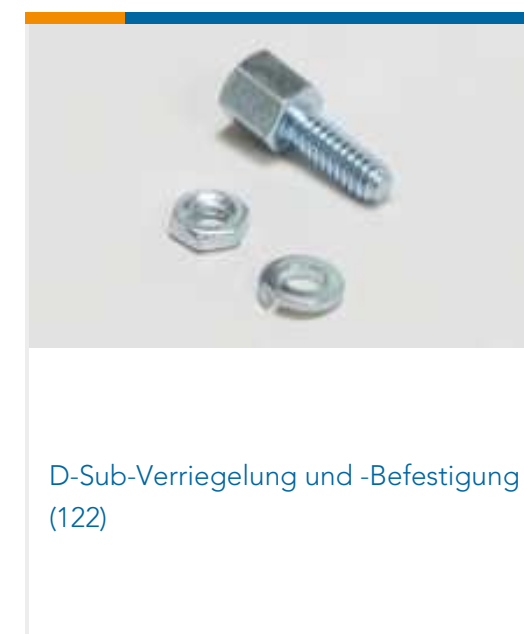
D-Sub-Verriegelung und -Befestigung (122)