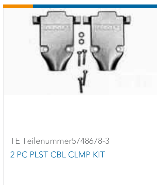
TE Teilenummer 5748678-3 2 PC PLST CBL CLMP KIT