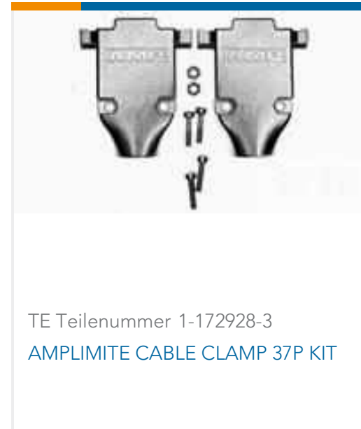
TE Teilenummer 1-172928-3 AMPLIMITE CABLE CLAMP 37P KIT