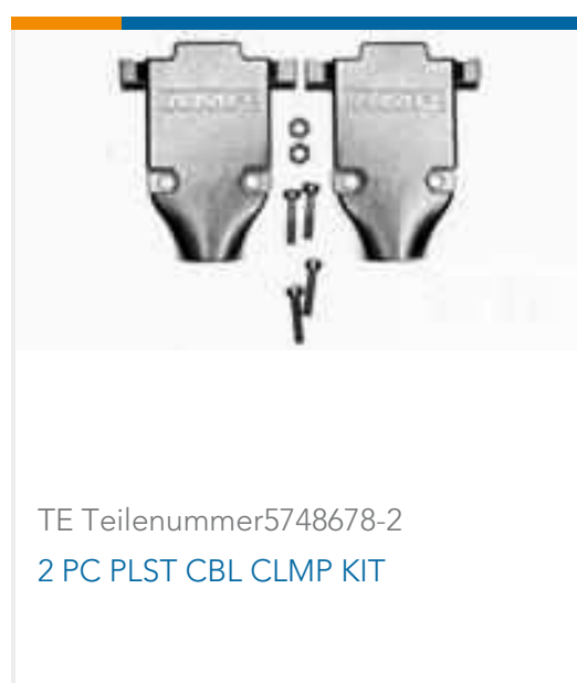
TE Teilenummer 5748678-2 2 PC PLST CBL CLMP KIT