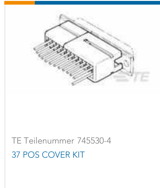
TE Teilenummer 745530-4 37 POS COVER KIT