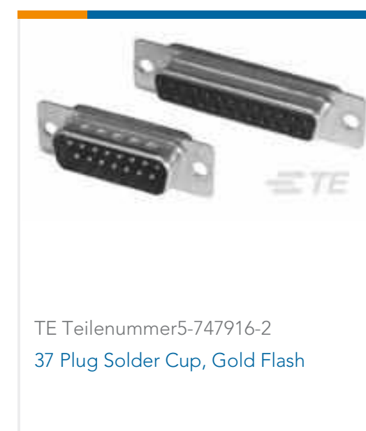
TE Teilenummer 5-747916-2 37 Plug Solder Cup, Gold Flash