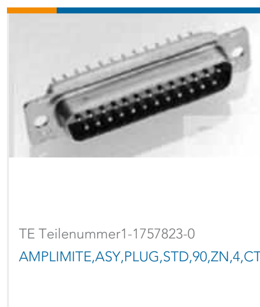
TE Teilenummer 1-1757823-0 AMPLIMITE, ASY, PLUG, STD, 90, ZN, 4, CT