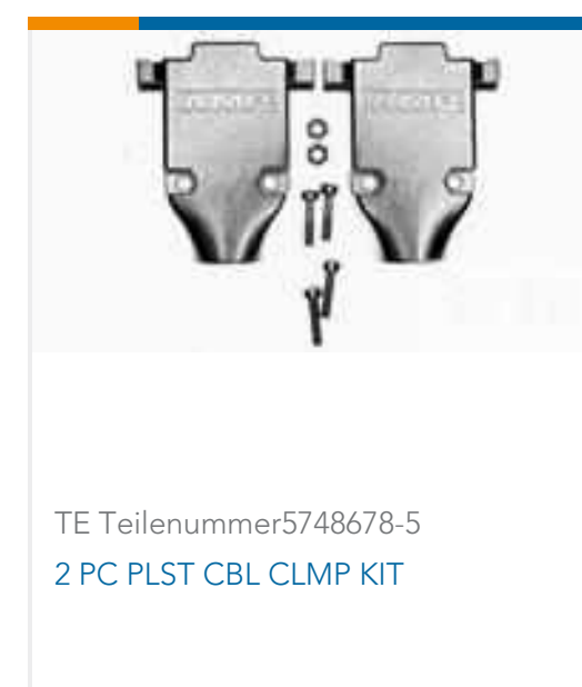
TE Teilenummer 5748678-5 2 PC PLST CBL CLMP KIT