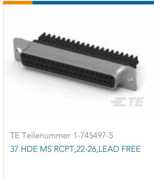
TE Teilenummer 1-745497-5 37 HDE MS RCPT, 22-26, LEAD FREE