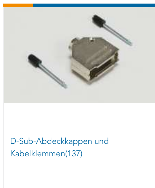
D-Sub-Abdeckkappen und Kabelklemmen (137)