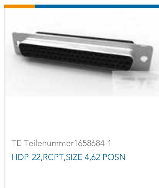
TE Teilenummer 1658684-1 HDP-22, RCPT, SIZE 4, 62 POSN