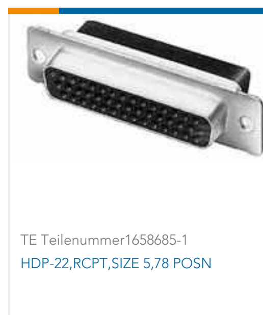
TE Teilenummer 1658685-1 HDP-22, RCPT, SIZE 5, 78 POSN