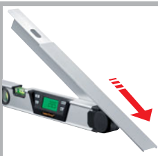
Schmiege ist nach unten...