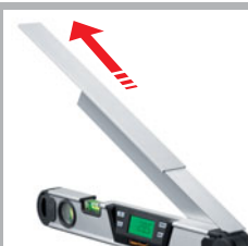
...und nach oben ausziehbar.