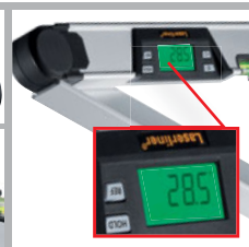
Display auf Tastendruck 180° drehbar

1. Innen- oder Außenwinkel von 0-220° exakt bestimmen: Beim Messen von Dachschrägen, Einpassen von Möbeln oder Fenstern an Ecken und Kanten.