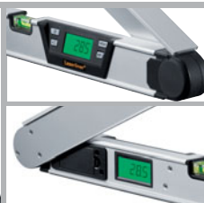
LC-Display auf Vorder- und Rückseite