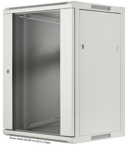
Shown: Model with 600 mm (23.6 in.) Depth