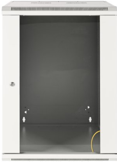
Shown: Model with 600 mm (23.6 in.) Depth