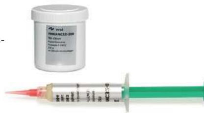
Flussmittelcreme Ersa No-Clean-Flussmittelcreme in unterschiedlichen Gebindegrößen

Überschüssige Reste entfernt man gegebenenfalls mit dem FLUX-REMOVER unter Zuhilfenahme saugfähiger, nichtfasernder Papiertücher oder speziell dafür angebotener ESD-sicherer Produkte.