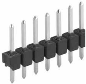
Leiterkartensteckverbinder>Stiftleisten Einreihig, □ 0,635 mm