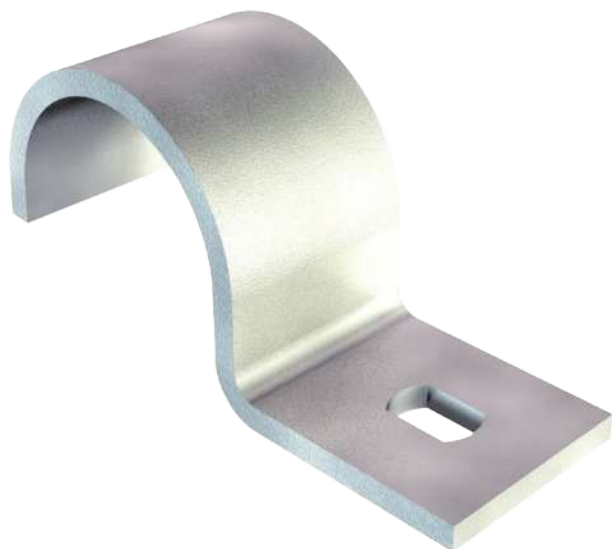
Befestigungsschelle einlappig 40mm