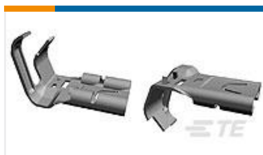
TE Teilnr.:63604-1 250 FASTON FLAG REC 18-12 AWG NPST