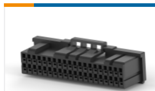
TE Teilnr.:1-2333134-0 DYNAMIC 1100D REC HSG X 40P BLACK 33%GF