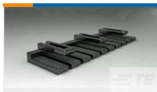
TE Teilnr.:1969443-4 EP 2.5 TPA Retainer, 4 Pos