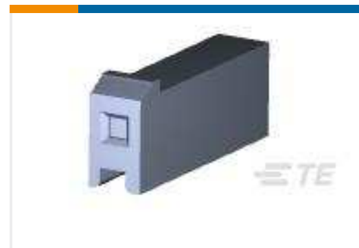
TE Teilnr.:640250-1 01P SL156 HSG W/LCK RAMP NATL