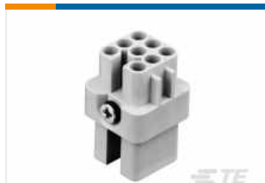
TE Teilnr.:T2020082201-000 HD-008-F