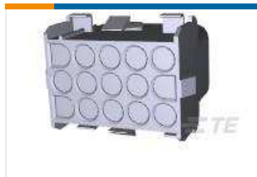
TE Teilnr.:1-480711-9 15P UMNL CAP HSG BLK