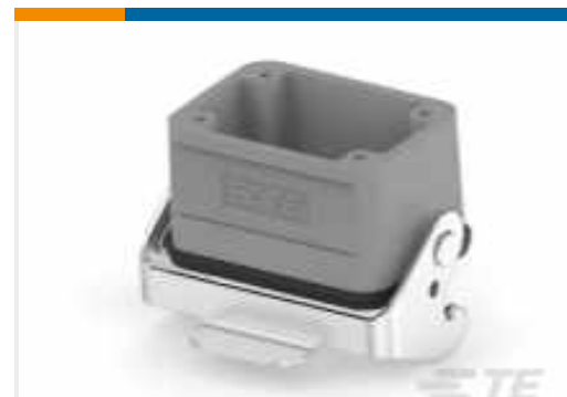
TE Teilnr.:T1730060000-000 H6B-TBF-T