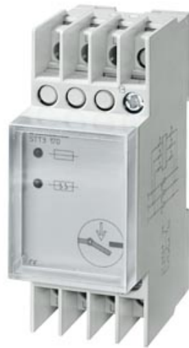
SICHERUNGSWAECHTER T55 3AC 380V BIS 415V MIT KLARSICHTKAPPE