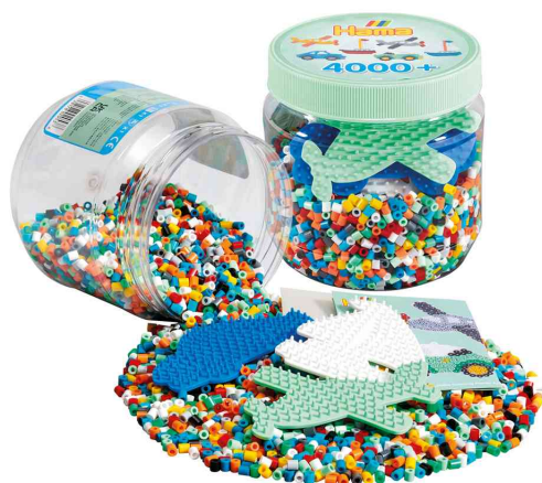
Perles à repasser midi + plaques à picots, 4.000 pièces dans un pot en plastique

ATTENTION: ne convient pas aux enfants de moins de 36 mois en raison des petites pièces qui peuvent être avalées.