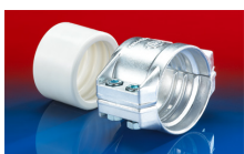
CONNECT SAFETY CLAMP ASSEMBLY 231