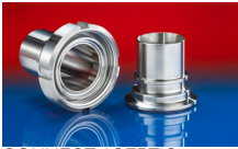
CONNECT ASEPTIC FITTING 249