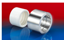
CONNECT PRESS ASSEMBLY 232