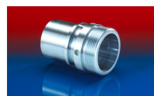
CONNECT THREAD FITTING 234