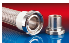
CONNECT MOULD ASSEMBLY 233