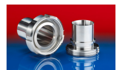
CONNECT DAIRY FITTING 247

Über- und Unterdruck sind empfohlene Betriebsgrenzwerte, auf Anfrage können Produkte höher belastet werden. Biegeradius gemessen an der Innenseite des Schlauchbogens. Weitere Technische Daten unter www.norres.com . Technische Änderungen vorbehalten. Alle Werte wurden bei 20°C ermittelt und sind ca. Angaben.