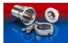
CONNECT TRI-CLAMP FITTING 245