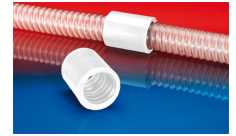
CONNECT 246 FOOD