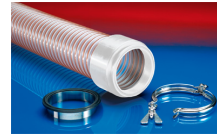
CONNECT 245 FOOD