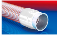
CONNECT 243 FOOD