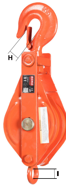
KBH2 = Zweirollig