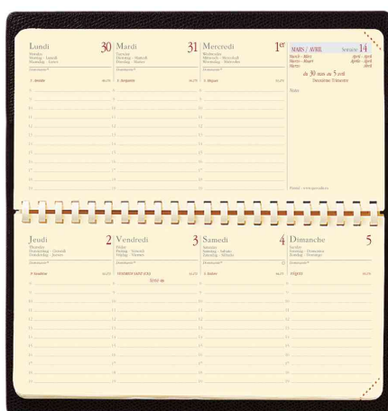
Agenda de poche "Planital", grille