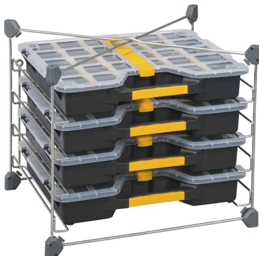
Visuel de référence : présente le produit en utilisation