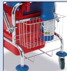
Utensilienkorb für Reinigungswagen mit einem 20-Liter-Eimer, Bestell-Nr. 130-321-J9