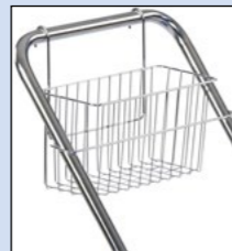
Einhängbarer Deichselkorb, Bestell-Nr. 130-317-J9