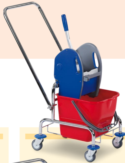
Eineimer-Reinigungswagen, mit umklappbarer Deichsel, Bestell-Nr. 130-312-J9

Ausstattung: 1 Auswringvorrichtung 1 Eimer à 20 Liter Maße außen B x T x H (mm): 400 x 490 x 870