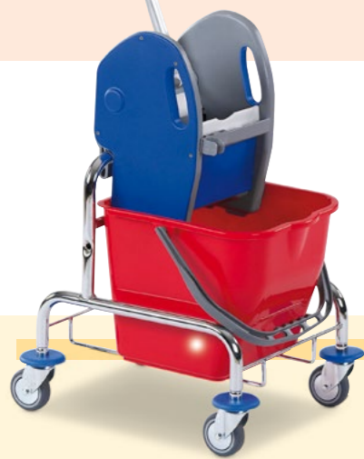
Eineimer-Reinigungswagen, Bestell-Nr. 130-314-J9

Ausstattung: 1 Auswringvorrichtung 1 Eimer à 20 Liter Maße außen B x T x H (mm): 400 x 490 x 870