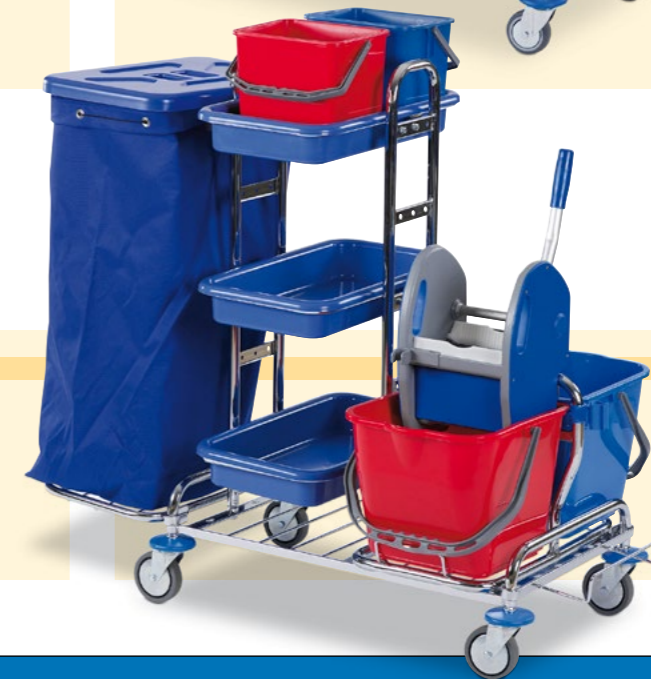
Reinigungswagen, Bestell-Nr. 130-324-J9

Ausstattung: 1 ausklappbare Deichsel 1 Auswringvorrichtung 2 Eimer à 20 Liter Maße außen B x T x H (mm): 420 x 720 x 890