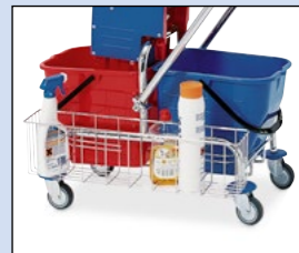
Utensilienkorb für seitliche Montage bei Reinigungswagen mit zwei 20-Liter-Eimern, Bestell-Nr. 130-369-J9