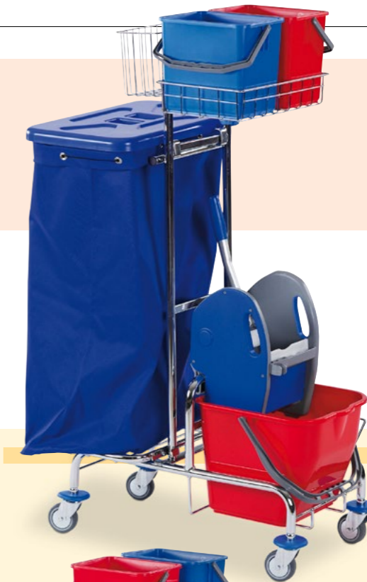
Reinigungswagen, Bestell-Nr. 130-322-J9

Ausstattung: 1 ausklappbare Deichsel 1 Auswringvorrichtung 1 Eimer à 20 Liter Maße außen B x T x H (mm): 420 x 760 x 890