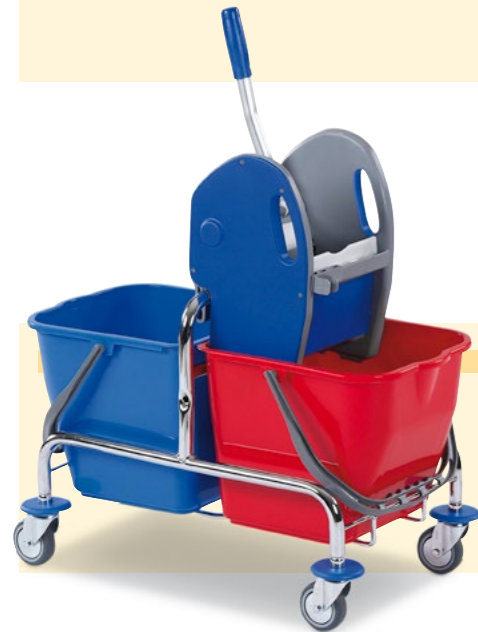
Zweieimer-Reinigungswagen, Bestell-Nr. 130-316-J9

Ausstattung: 1 Drahtkorb 2 Eimer à 6 Liter 1 Halterahmen für 120 Liter Abfallsack 1 Ablagerost für 120 Liter Abfallsack 1 Auswringvorrichtung 1 Eimer à 20 Liter Maße B x T x H (mm): 800 x 680 x 1050