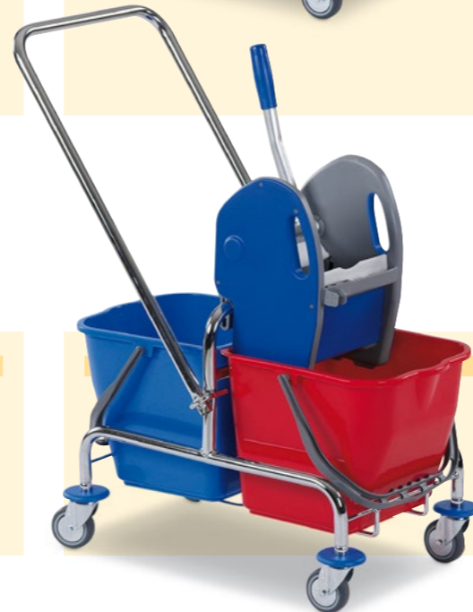
Zweieimer-Reinigungswagen, mit umklappbarer Deichsel, Bestell-Nr. 130-315-J9

Ausstattung: 1 Auswringvorrichtung 2 Eimer à 20 Liter Maße außen B x T x H (mm): 420 x 700 x 870