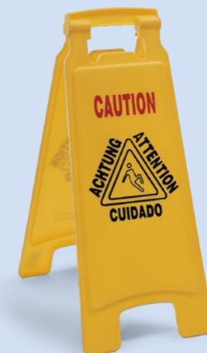
Set mit 2 Warnaufstellern