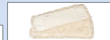
Breite 40 cm, Bestell-Nr. 130-326-J9