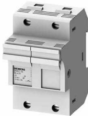
SENTRON, Zylindersicherungshalter, 14x51 mm, 2-polig, In: 50 A, Un AC: 690 V