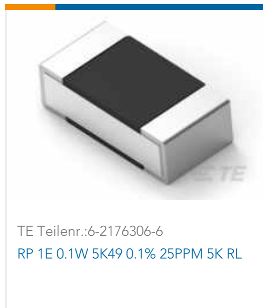
TE Teilnr.:6-2176306-6 RP 1E 0.1W 5K49 0.1% 25PPM 5K RL