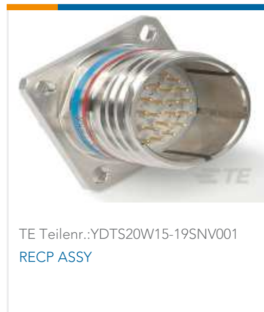
TE Teilnr.:YDTS20W15-19SNV001 RECP ASSY