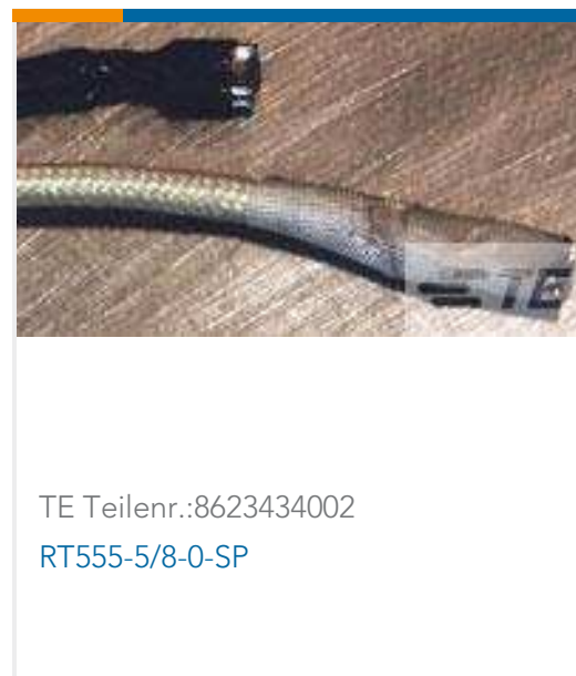
TE Teilnr.:8623434002 RT555-5/8-0-SP