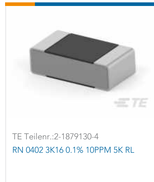
TE Teilnr.:2-1879130-4 RN 0402 3K16 0.1% 10PPM 5K RL