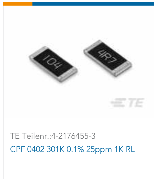
TE Teilnr.:4-2176455-3 CPF 0402 301K 0.1% 25ppm 1K RL