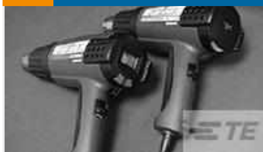
TE Teilenummer CJ2087-000 HL2010E-KIT-120V