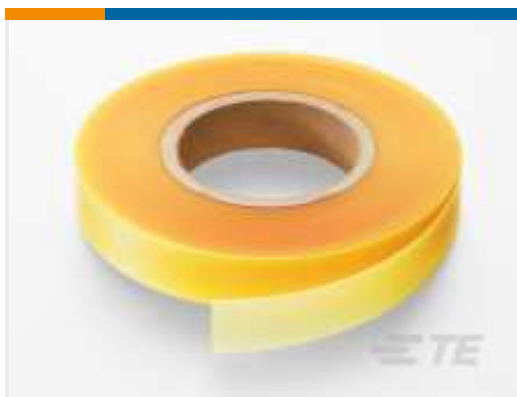
TE Teilenummer890113-000 S1048-TAPE-1X100-FT