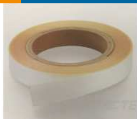
TE Teilenummer890060-000 S1017-1.0X50