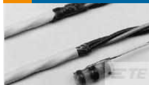
TE Teilenummer676516-000 S03-03-R