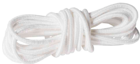
Cordon élastique, blanc