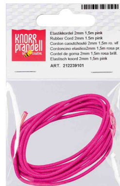
Visuel de référence : Cordon élastique, emballage