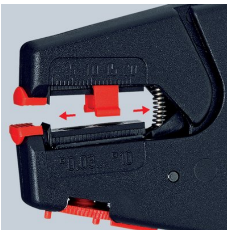
12 40 200: Einstellbarer Längenanschlag

Technische Änderungen und Irrtümer vorbehalten