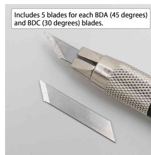
Visuel de référence : incl. 5 lames de chaque