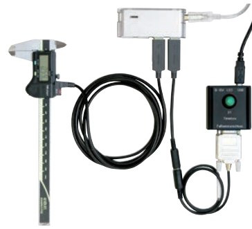
Alkalmazási minta USB Input Tool Direct eszközzel