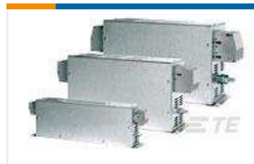
TE Teilnr.:2-1609091-6 16BCF6=F8233B