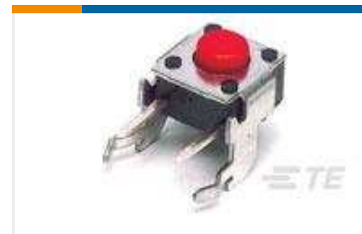
TE Teilnr.:1571610-1 Sealed R/A Tact switch, Sealed