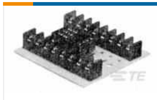
TE Teilnr.:1393837-1 27E460=SOCKET,R10,,ASSY,2 POLE