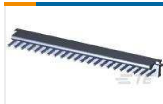
TE Teilnr.:2-640456-2 22P MTA100 HDR ASSY F/L SQ STR