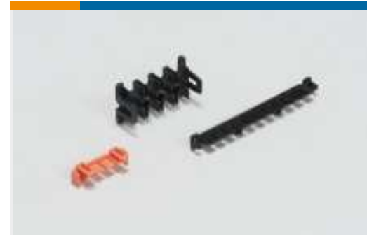
Verriegelung von rechteckigen Steckverbindern(8)