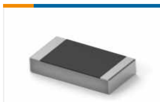
TE Teilnr.:3-2176458-0 CPF 1206 2R0 0.1% 25ppm 1K RL