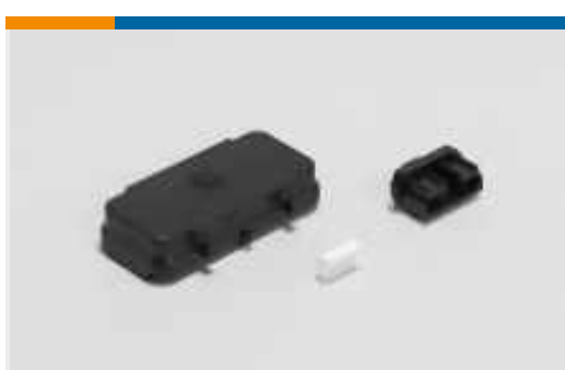
Rechteckige Kappen und Abdeckungen(2)