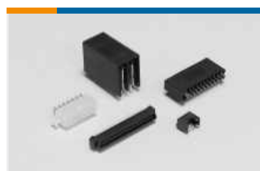
Rechteckige Standardsteckverbinder (10)