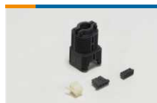
Rechteckige Steckverbindergehäuse (20)