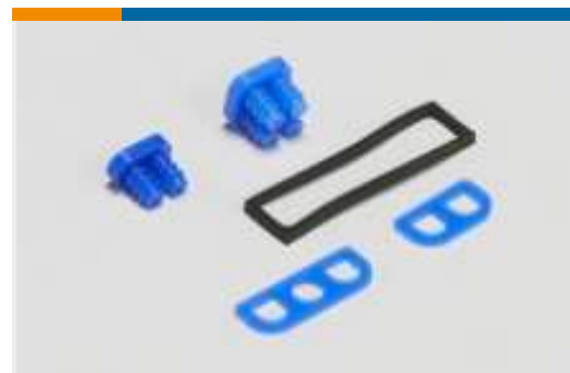
Dichtungen für rechteckige Steckverbinder(1)