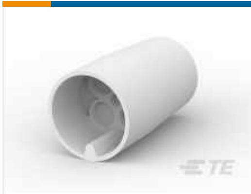
TE Teilenummer 925075 4W CIRCULAR MATE-N-LOK PIN HSG NAT