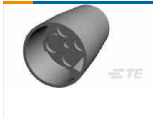
TE Teilenummer 925075-3 4W CIRCULAR MATE-N-LOK PIN HSG BLK