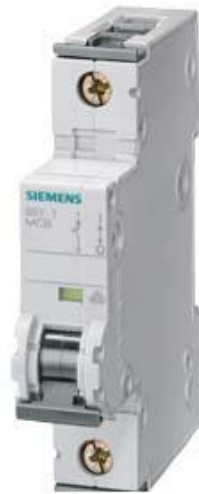
LEITUNGSSCHUTZSCHALTER 230/400V 10KA, 1-POLIG, A, 16A, T=70MM