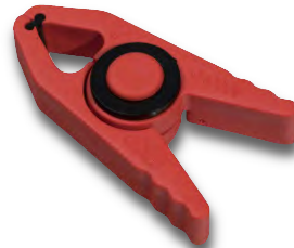
Sicherheitsklammer Best. Nr. 651406