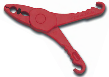
Sicherheitsklammer mit Haken Best. Nr. 651402