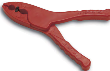
Sicherheitsklammer ohne Haken Best. Nr. 651407