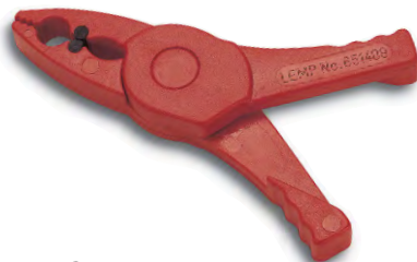
Sicherheitsklammer kurze Ausführung Best. Nr. 651409