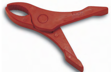
Sicherheitsklammer mit 65 mm Öffnungsweite Best. Nr. 651412