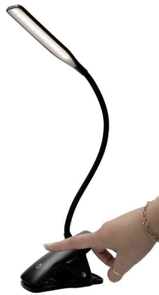
Lampe de lecture LED rechargeable "LEDCLIP" - interrupteur on/off