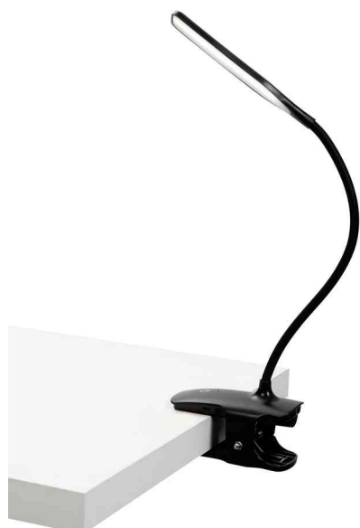
Visuel de référence: montre la lampe sur un plateau