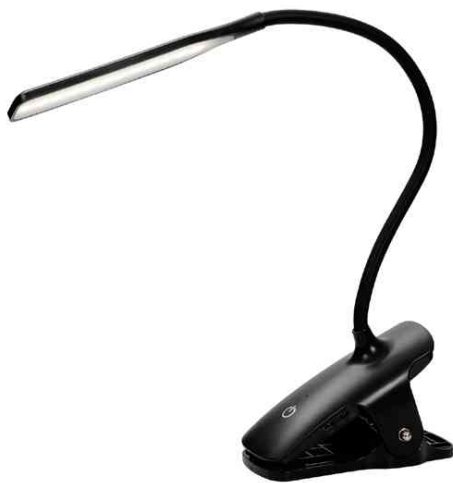
Lampe de lecture LED rechargeable "LEDCLIP" - bras flexible