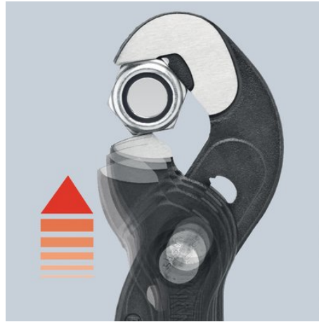
Nauwkeurige instelling door druk op de knop: snel en gemakkelijk