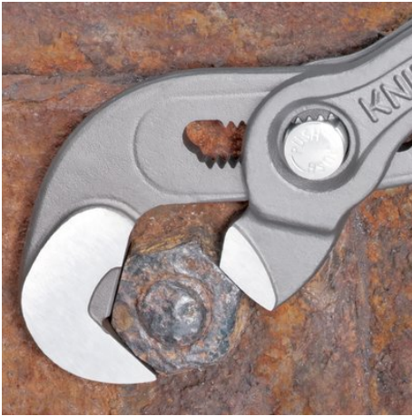
Werken aan vastzittende schroeven met afgeronde kanten

Zelfklemende functie verhindert dat de tang wegglijdt en vereist minder kracht