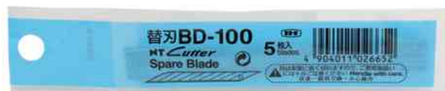
Visuel de référence : emballage (étui)