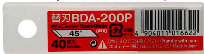
Visuel de référence : emballage (boîte)