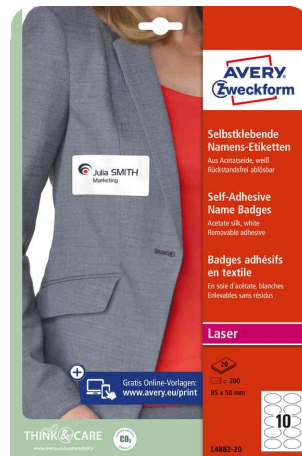
Namensetiketten - oval