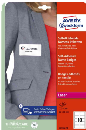
Namensetiketten - eckig