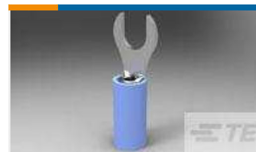
TE Teilnr.:36954 PIDG SLTD 22-16COMM 22-18MIL 8