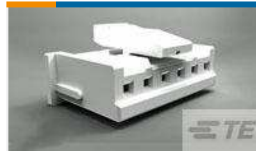
TE Teilnr.:1969442-4 EP 2.5 TPA Housing, 4 Pos