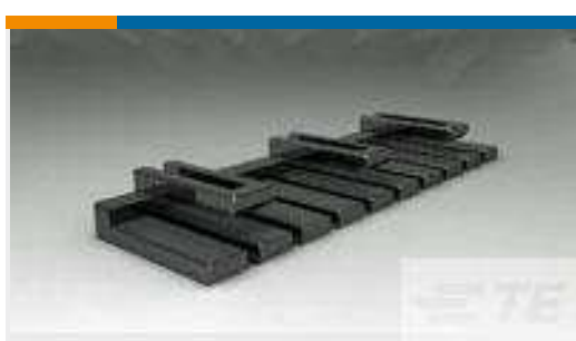
TE Teilnr.:1969443-2 EP 2.5 TPA Retainer, 2 Pos