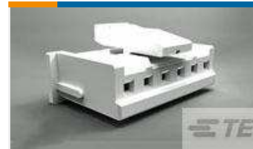
TE Teilnr.:1969442-5 EP 2.5 TPA Housing, 5 Pos