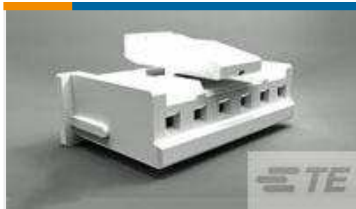
TE Teilnr.:1969442-6 EP 2.5 TPA Housing, 6 Pos