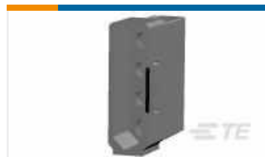
TE Teilnr.:770336-1 04P .093 COMM P&S PLUG .250CL