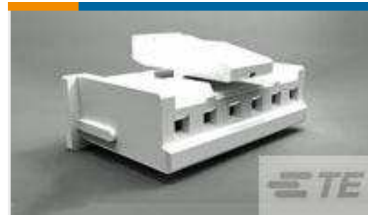
TE Teilnr.:1969442-3 EP 2.5 TPA Housing, 3 Pos