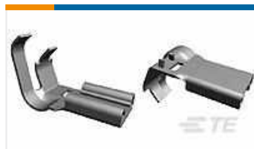
TE Teilnr.:42800-1 187 FASTON REC 20-16 AWG BR