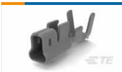
TE Teilnr.:2110989-1 EP 2.5 RCPT CONTACT, 26-22 AWG