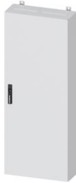
ALPHA 400 DIN UP-Wandverteiler Unterputz, IP31, Schutzklasse 1, H=1400mm, B=550mm, T=210mm RAL 9016