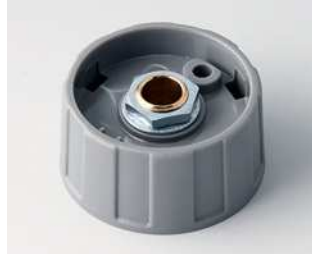
A2531068 RUNDKNOPF 31, ohne Strich ABS (UL 94 HB) staubgrau RAL 7037 31x15mm 6mm