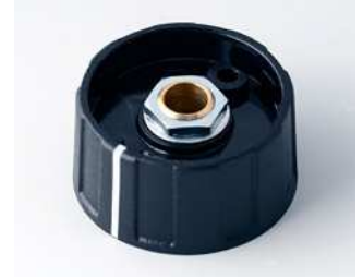
A2631060 RUNDKNOPF 31, mit Strich ABS (UL 94 HB) schwarz RAL 9005 31x15mm 6mm