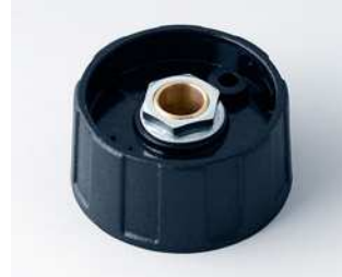
A2531630 RUNDKNOPF 31, ohne Strich ABS (UL 94 HB) schwarz RAL 9005 31x15mm 1/4"