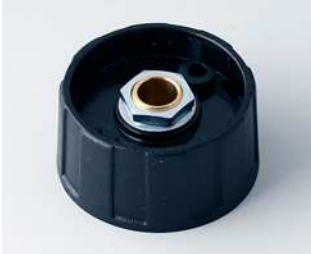
A2531060 RUNDKNOPF 31, ohne Strich ABS (UL 94 HB) schwarz RAL 9005 31x15mm 6mm