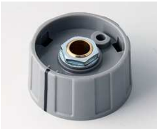
A2631068 RUNDKNOPF 31, mit Strich ABS (UL 94 HB) staubgrau RAL 7037 31x15mm 6mm

Technische Änderungen vorbehalten.