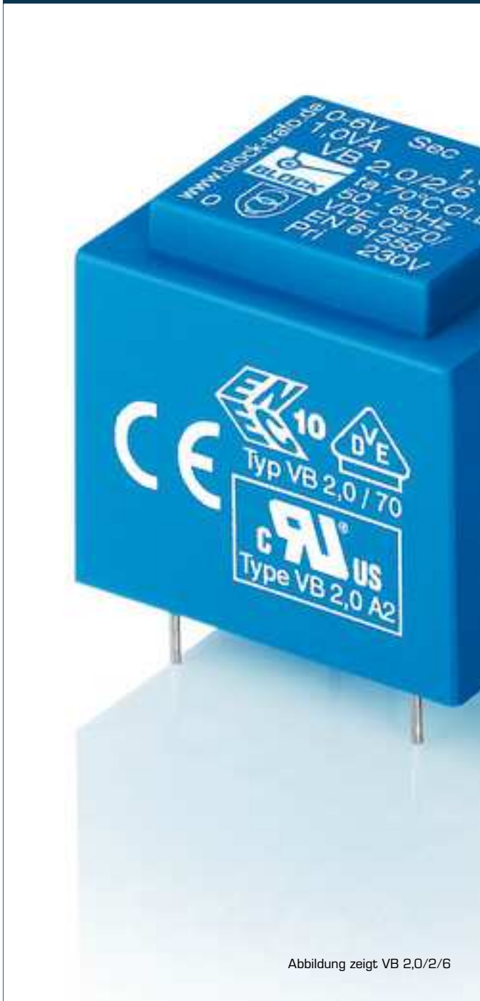
Abbildung zeigt VB 2,0/2/6