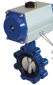
Typ KLZ (Zwischenflansch)