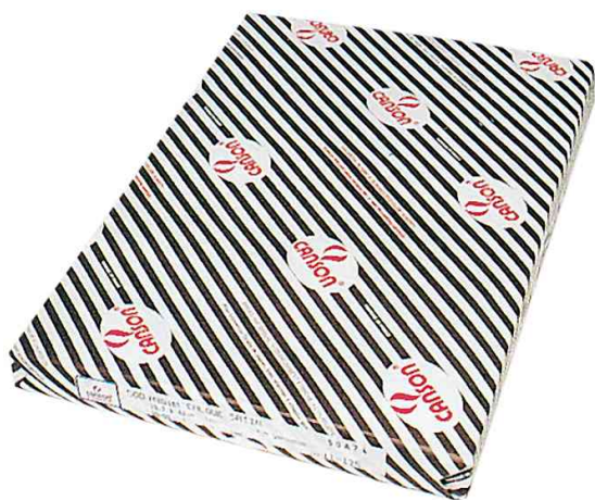
Visuel de référence: Papier calque, feuilles