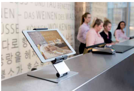
Visuel de référence: présente le produit en utilisation