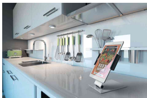
Visuel de référence : présente le produit en utilisation