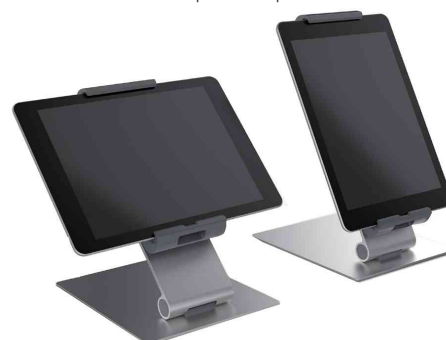
Visuel de référence: utilisable en format portrait ou paysage