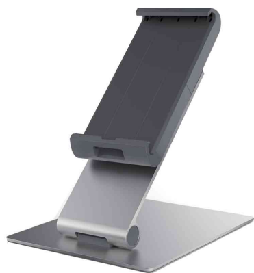
Support de table pour tablette "TABLET HOLDER TABLE"

- présentation professionnelle de tablettes dans les bureaux, édifices publics ainsi que les locaux de vente et d'exposition