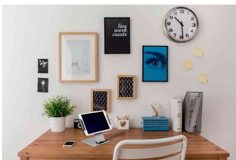
Visuel de référence : présente le produit en utilisation