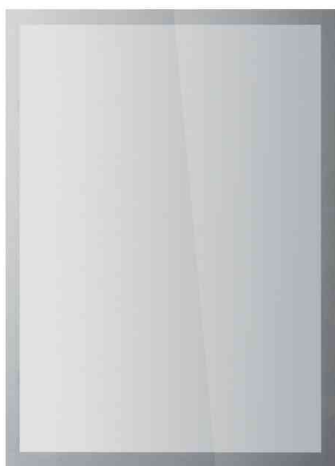
DURAFRAME SUN, argent