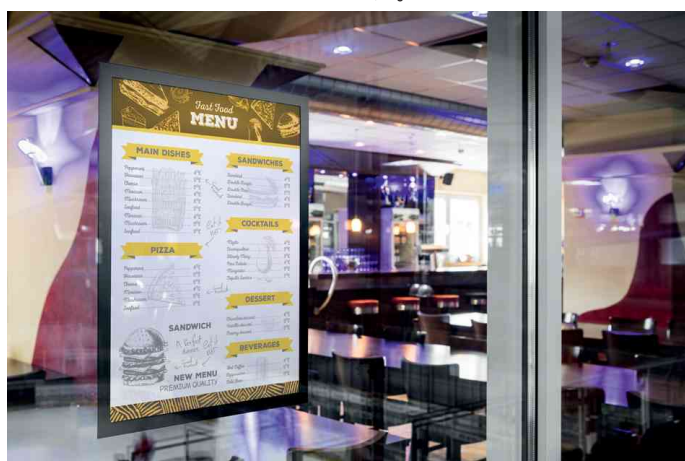
Visuel de référence: exemple d'utilisation