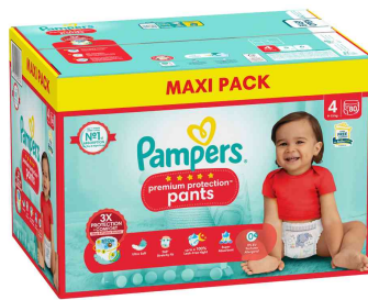
Visuel de référence : Premium Protection Pants, Maxi Pack