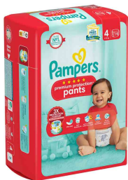
Visuel de référence : Premium Protection Pants, Single Pack

Taille 6 : Extra Large - pour les enfants de 15 kg et plus