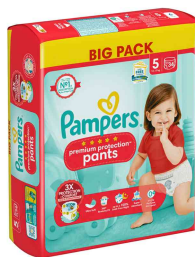
Visuel de référence : Premium Protection Pants, Big Pack