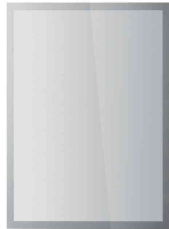
DURAFRAME SUN, silber