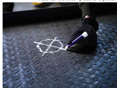
Visuel de référence : présente le produit utilisé sur le métal